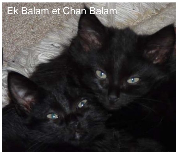
Ek Balam et Chan Balam

Adopter un chat, ce n'est pas acquérir un jouet, mais ouvrir son coeur et son foyer à un compagnon pour toute une longue vie de complicité.